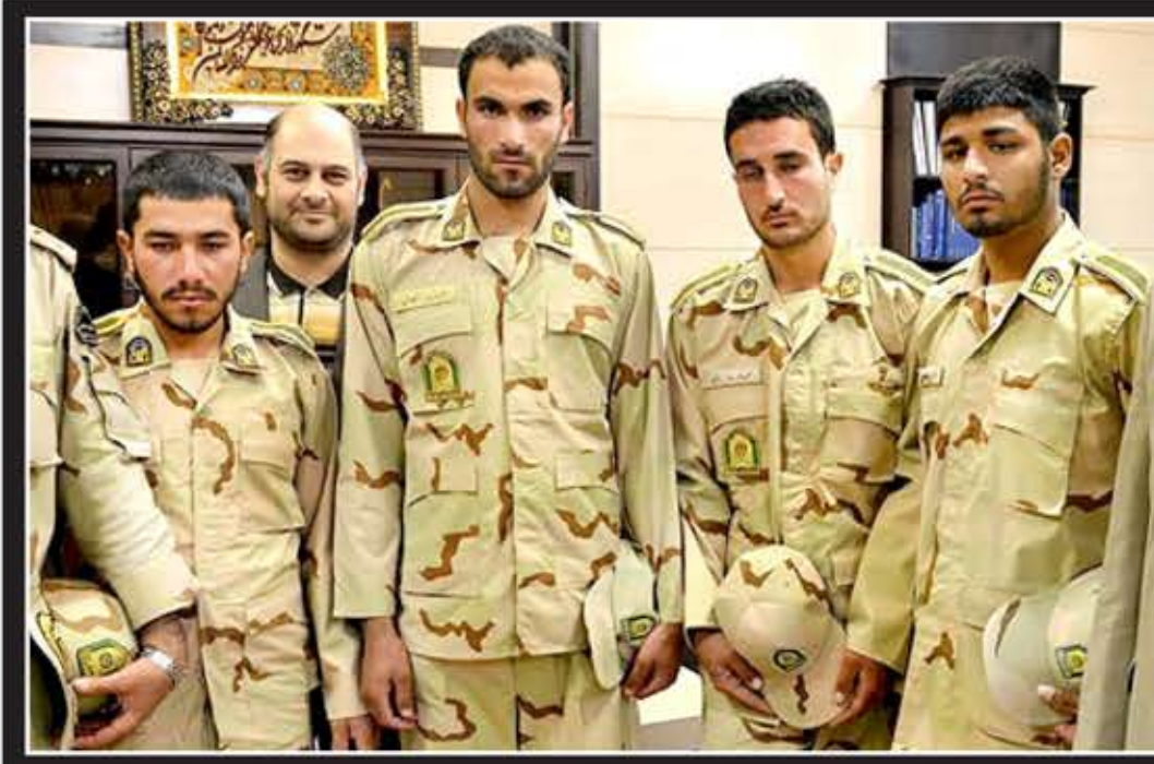
پنج منهای یک بر خاک وطن بوسه زد

گزارش مرتبط در همین صفحه