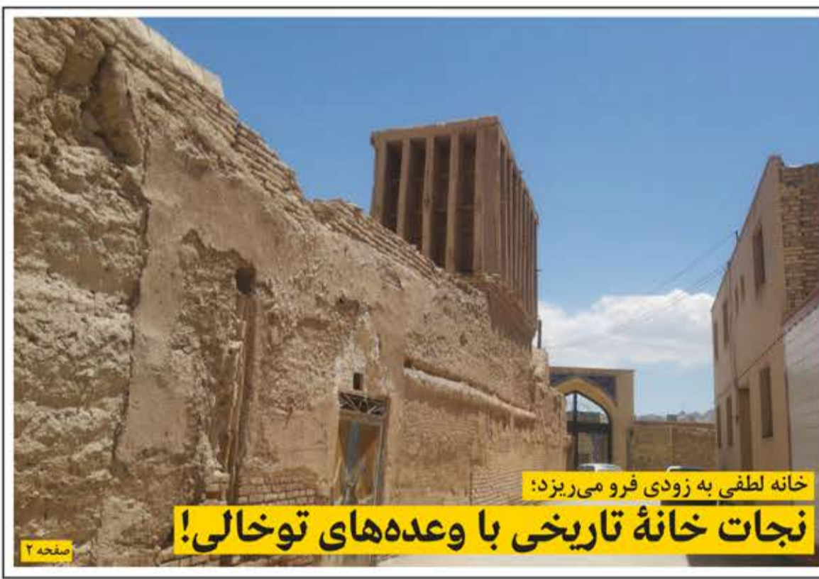
خانه لطفی به زودی فرو می‌ریزد: