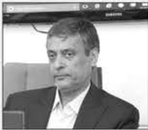
گروه اقتصاد - رئیس اتاق کرمان

با بیان این‌که سال گذشته ۲۵ هزار نفر در استان کرمان شغل خود را از دست داده‌اند که بیشتر آن‌ها در صنایع کوچک و متوسط بوده‌اند و به دلیل حمایت جدی از این صنایع همواره مورد تأکید قرار داد.