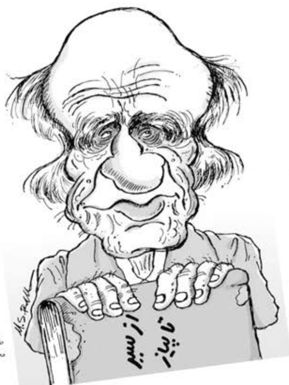
طرح: محمد صالح رزم حسینی

اوست نامش محمد ابراهیم بساتنی ترین پاریزی باد بر شانه اش گل می ریخت باد ختان سرو و سیریزی